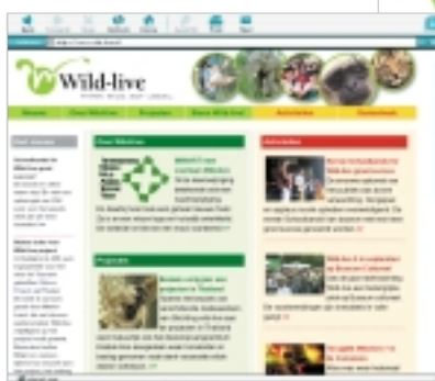
Met de compleet nieuwe website en huisstijl zijn we klaar voor de toekomst.