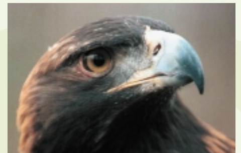
De zeldzame Golden Eagle wordt in zijn bestaan bedreigd.

Een aantal partijen binnen en buiten Roemenië onderneemt op dit moment al stappen om dit voor Europa unieke natuurgebied te behouden. Daarbij heeft het parkmanagement ingezien dat dit in samenwerking mét en niet tégen de lokale bevolking moet. Zo zoeken parkmedewerkers en de lokale bevolking samen naar oplossingen voor overbegrazing van de kwetsbare bergweiden door schapen, worden kleinschalige ecotoeristische activiteiten