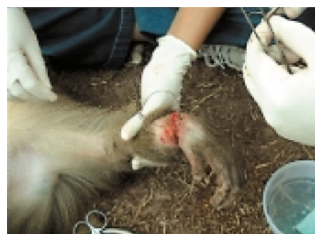
Bijtwond bij makaak wordt gehecht.

ontwormingskuur, zelf uit te kunnen voeren. Als laatste zal de vaste dierenarts ook studenten diergeneeskunde gaan begeleiden tijdens praktijkstages gericht op het omgaan en behandelen van wilde dieren.