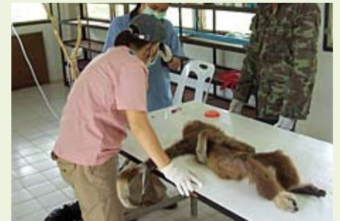
Gibbon wordt onderzocht.

Op dit moment verkent de stichting de mogelijkheden voor samenwerking met twee nieuwe projecten: een project in Roemenië gericht op het beschermen van het natuurreservaat Retezat en een olifantenproject in Thailand. Hierover binnenkort meer.