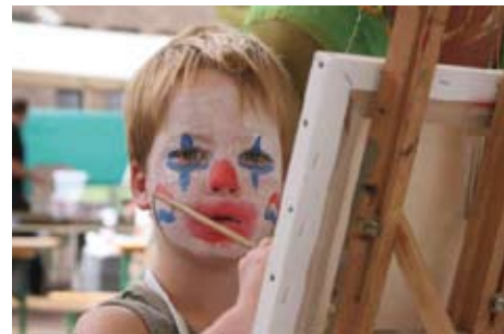
Het KinderKunst Atelier bleek een groot succes.

De ambities voor 2007 zijn groot. Het plan is om dat jaar een 'mega' Wild-live festival te organiseren. In 2007 bestaat het Wild-live festival alweer 5 jaar. Nu al hebben rond de 40 verschillende bands en artiesten