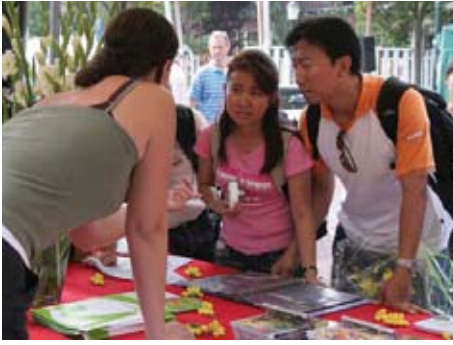
Thaise studenten op bezoek bij de Wild-live stand.

Na drie jaar te hebben plaatsgevonden is begin november het evenement Bussum Cultureel geëvalueerd door alle organiserende partijen. Stichting Wild-live is vanaf het eerste jaar als één van de organisatoren bij het evenement betrokken. Sindsdien is er door de belangeloze inzet van alle medewerkers veel tot stand gebracht.