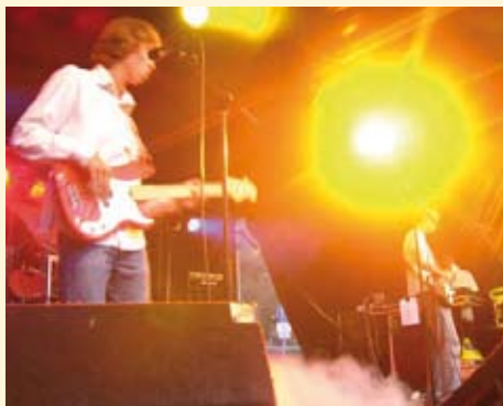
Funkatrankus speelt de het dak eraf.