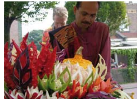
Prachtige kunstwerken gesneden uit fruit.

moet passen binnen de doelstellingen van Stichting Wild-live (zoals bijdragen aan natuurbehoud en aan de ontwikkeling in arme landen). Daarnaast dient het goede doel een initiatief te zijn van de lokale bevolking en moet de ontvangende partij vanzelfsprekend wel een goede reputatie hebben. Zo snijdt het mes aan twee kanten. Goede doelen ingediend door de inwoners van Bussum en omgeving komen aan bod en Stichting Wild-live kan haar doelstellingen blijven realiseren. Een ander voordeel is dat er door deze werkwijze nieuwe contacten ontstaan tussen de stichting en andere natuurbeschermers uit de regio.